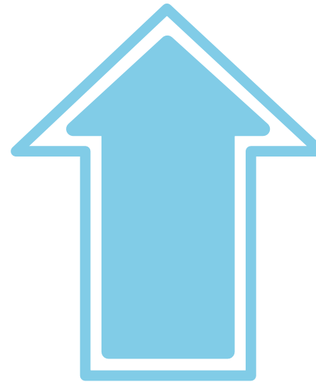
Symbol für Navigatorin / Navigator (derjenige, der bestimmt, was wie programmiert wird)

Drucke die Zeichen für jedes Programmiererteam einmal aus. Sie dienen dann als Orientierung für die jeweilige Rolle im Projektablauf.